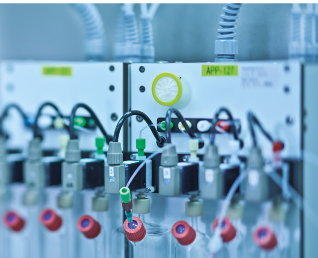
Die Ventile arbeiten vollautomatisch