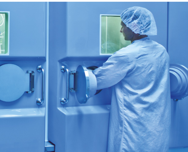
Die Mitarbeiter bedienen das Gerät durch Bleitüren