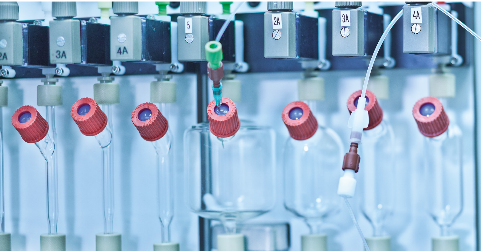
Die Ventile steuern den Syntheseprozess

Die Positronen-Emissions-Tomografie (PET) dient der Visualisierung und Charakterisierung biologischer Prozesse im lebenden Organismus. Das komplizierte und teure Verfahren hat einen ernsten Hintergrund: die präzise Diagnose von Krebserkrankungen. Dazu werden Funktionsstörungen oder pathologische Veränderungen mittels krankheitsspezifischer, radioaktiv markierter Substanzen, den PET-Tracern, sichtbar gemacht. Somit können chirurgische Eingriffe mithilfe der molekularen Bildgebung leichter geplant werden, da der Arzt die genaue Position des Tumors im Körper identifizieren kann. Da die radioaktiven PET-Tracer nur geringe Halbwertszeiten haben, müssen Sie möglichst am Ort der Verwendung erzeugt werden. Eine Grundvoraussetzung dafür ist bis ins Detail zuverlässige Technik. Zur Erzeugung der Tracer Substanzen benötigen Forschungseinrichtungen wie das VUmc in Amsterdam ein eigenes Zyklotron, in dem die radioaktiven Substanzen erzeugt werden. Ein Zyklotron ist ein Kreisbeschleuniger, der aus zwei D-förmigen Kammern