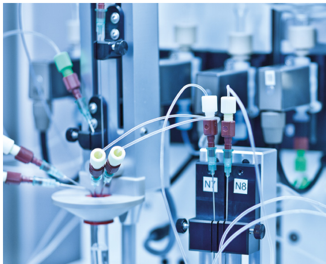
Höchste Präzision an jeder Stelle im Instrument