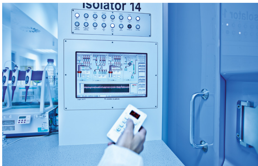
Steuerung des Instruments