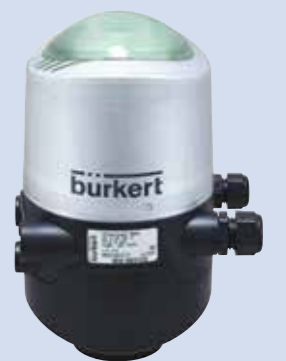
Steuerkopf 8681 mit farbig leuchtender Statusanzeige