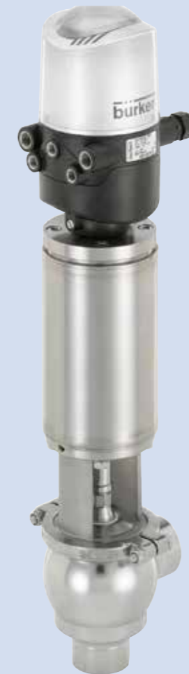
Hygienisches Prozessventil dezentral automatisiert.