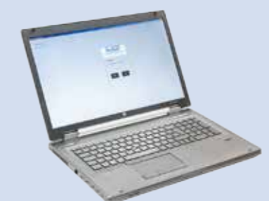
Parametrierung / Konfiguration und Servicefunktionen via Notebook über USB-Schnittstelle